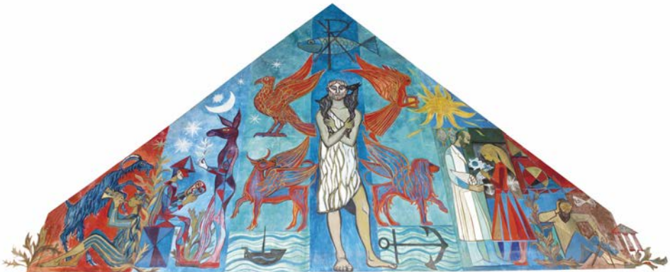
Fresco in de Aula